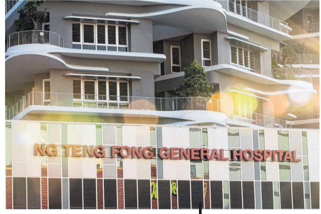
10月 | 两医院正式开幕。