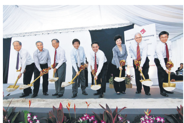
11月 | 两医院举行奠基仪式。