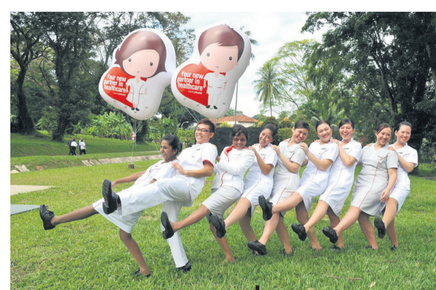
7月 | 庆祝第一个护士日。