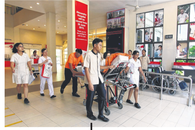
6月 | 黄廷方综合医院投入服务。