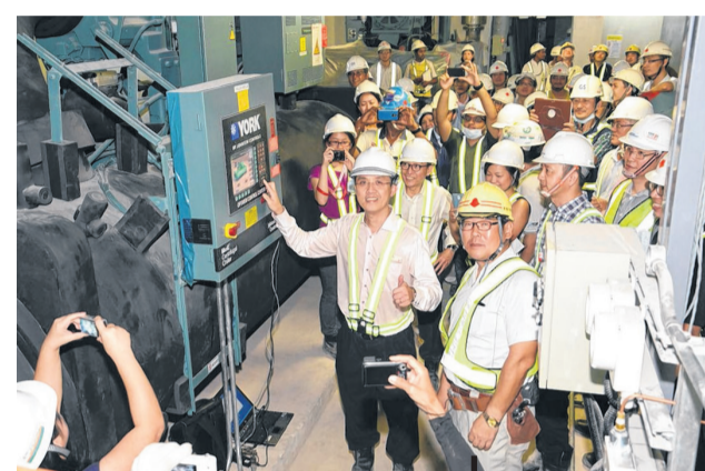
5月 | 启动冷气供应。