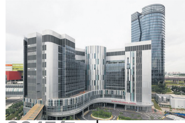
2015年2月 | A座大楼获得临时入伙准证。